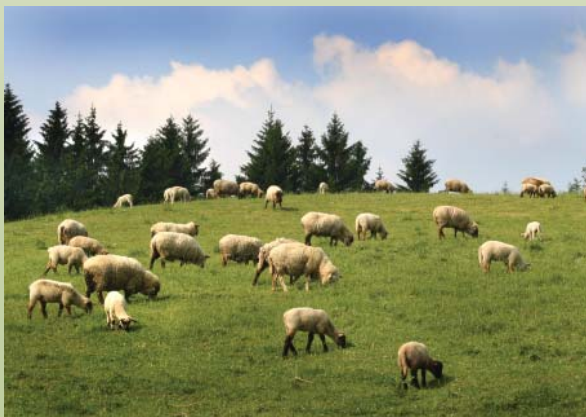
Pastvou ovčí jsou udržována i chráněná maloplošná území (na obrázku PR Ploščiny, CHKO Bílé Karpaty)

Konzumací jehněčího masa podpoříte místní farmáře, kteří v krajině žijí a hospodaří a rozhodující měrou se podílejí na záchraně druhově bohatých luk a pastvin.